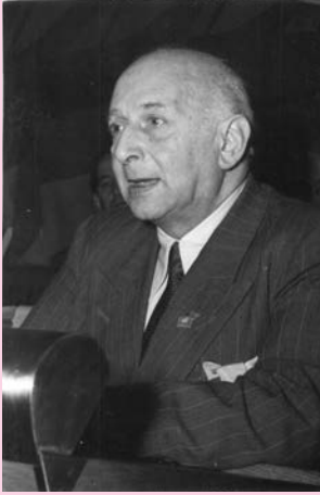
© Quaschinsky, Hans-Günter - 20 Novembre 1951