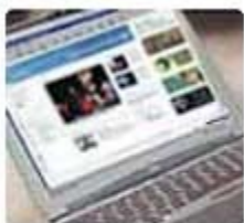
Internacia Televido, la esperantista TV

ITV komencis testi la elsendon la 1-an de aŭgusto 2005